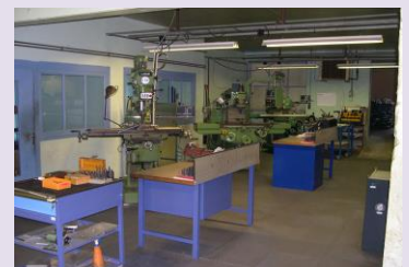
CUV 4 axes HARTFORD PRO1000 XYZ : 1000x600x630